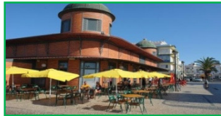
Mercado de Olhão

Siga depois até à cidade de Olhão, onde a sua história está ligada à indústria pesqueira local e a arquitectura da sua zona histórica revela a influência árabe na região. Na avenida à beira mar, num ambiente frenético do mercado, pode admirar a diversidade de peixes e mariscos frescos.