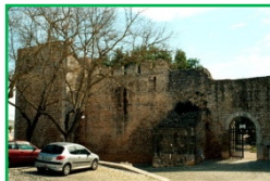
Muralha do Castelo de Tavira

Ainda naquela cidade desfrute de uma refeição de peixes e mariscos acabados de pescar, terminando com os folhados de Olhão.