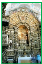
Igreja de Stº Antonio

partiram em frágeis caravelas, abrindo caminho a grandes descobrimentos. De entre os inúmeros locais que poderá visitar em Lagos, não deixe de conhecer a Igreja de Santo António pela beleza do trabalho em talha dourada e os seus azulejos, assim como as Igrejas de São Sebastião e de Santa Maria da Misericórdia e o Castelo dos Governadores . Repare ainda nas