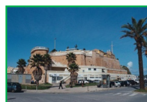
Fortaleza de Santa Catarina

Deixando Portimão, dirija-se até Lagos, cidade de grande prestígio histórico e muito ligada ao mar, donde no séc. XV, os homens do Infante D. Henrique