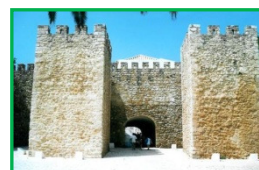
Castelo dos Governadores

Não perca ainda a oportunidade de conhecer a aldeia mais típica do Algarve. Os lugares de interesse incluem as ruínas do Castelo Árabe , a Igreja Matriz e a capela de Nossa Senhora de Lurdes , decorada com azulejos sevilhanos raros que datam do Século XVI. Existem ainda duas fontes, a Fonte Pequena e a Fonte Grande, à sombra de árvores antigas, que convidam o visitante a sentar-se numa das mesas em pedra.